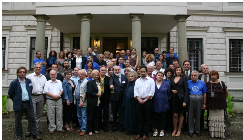
VIII Konferencja Filozofów Krajów Słowiańskich, Iwonicz, 21–24 VI 2012 r.