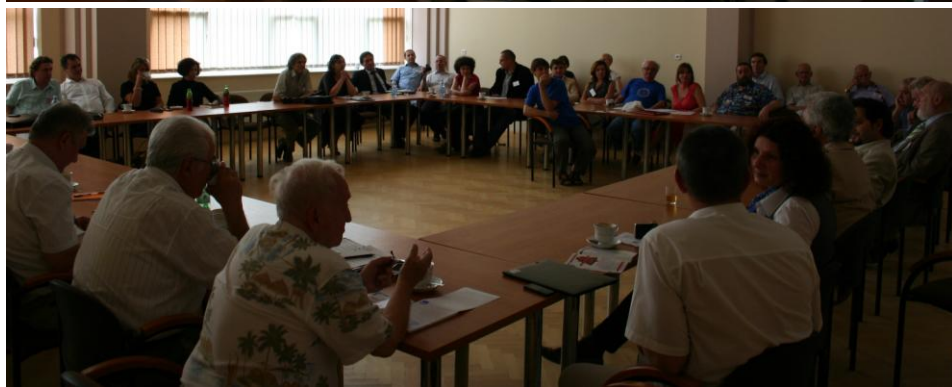
Obrady Okrągłego Stołu Filozofów Krajów Słowiańskich, Iwonicz, 23 VI 2012 r.