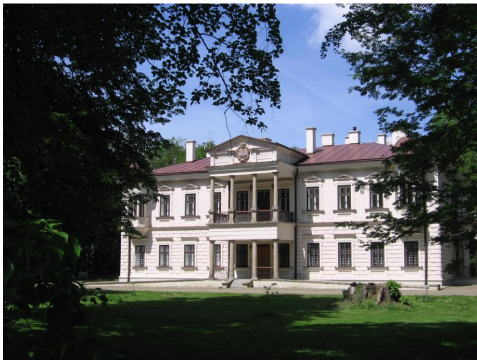
Pałac Żałuskich herbu Junosza w Iwoniczu, wybudowany w 1883 roku (obecnie jako Międzynarodowe Centrum Edukacji Ekologicznej Uniwersytetu Rzeszowskiego), miejsce obrad VIII Konferencji Filozofów Krajów Słowiańskich (21–24 VI 2012)