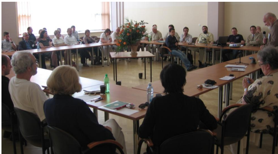
Obrady Okrągłego Stołu Filozofów Krajów Słowiańskich (18 VI 2010 r.)