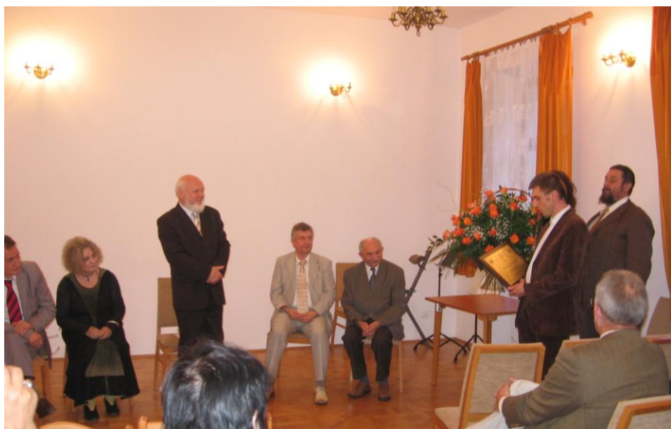
wieczór jubileuszowy, 17 VI 2010 r.